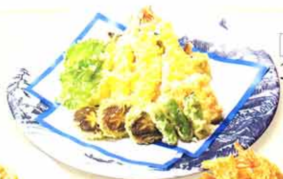
002 天ぷら盛り合せ 3,675円(税込)