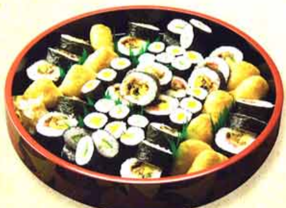
007 巻き寿司セット 5,250円(税込)