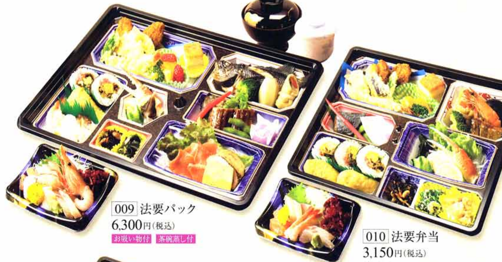
009 法要パック 6,300円(税込) お吸い物付 茶碗蒸し付