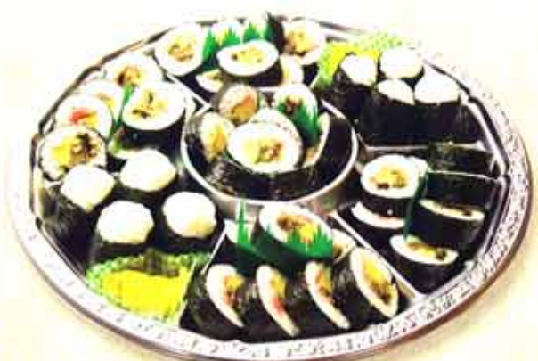
008 巻き寿司・おにぎりセット 5,250円(税込)