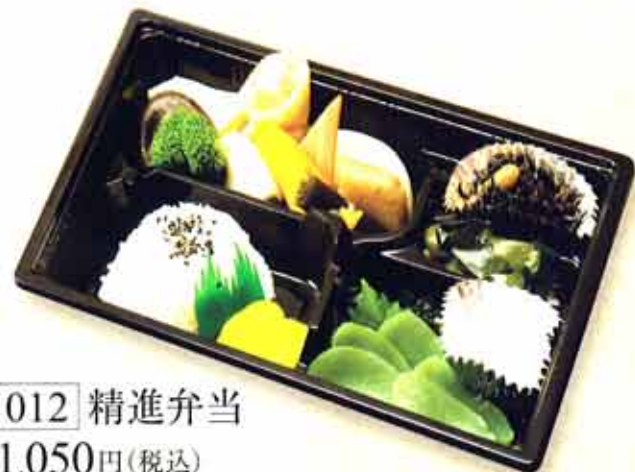
012 精進弁当 1,050円(税込)