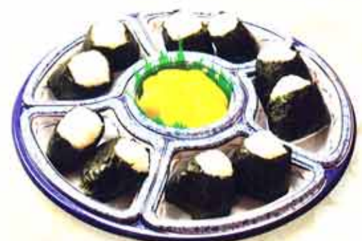
014 おにぎり 1,575円(税込)