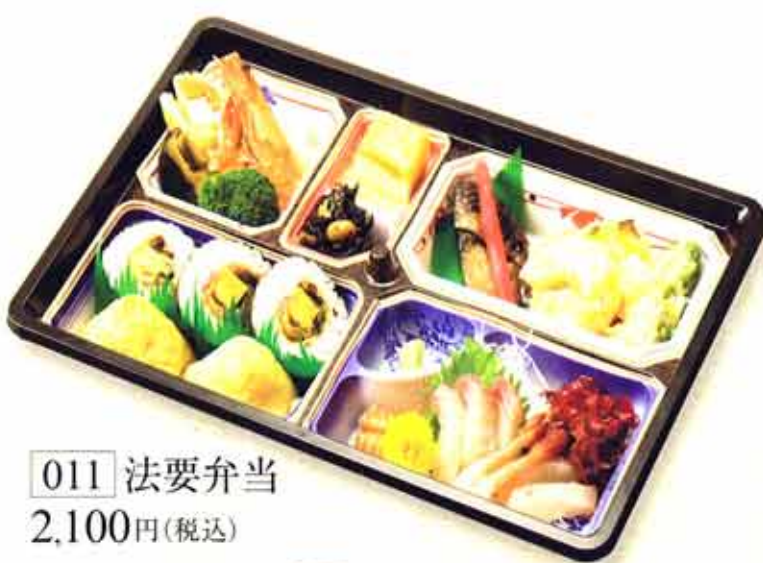
011 法要弁当 2,100円(税込)