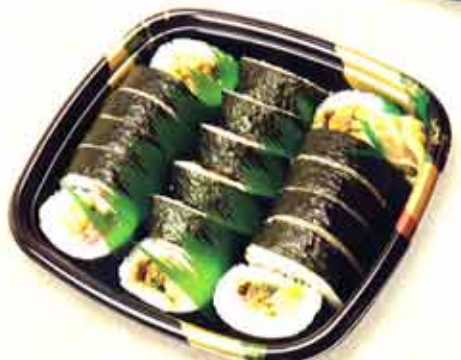
013 巻き寿司 2,100円(税込)