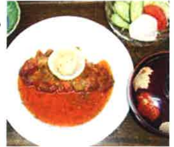
ポークソテーセット 880円