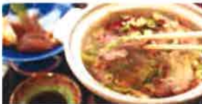
いのしし酒蒸しセット 1,880円